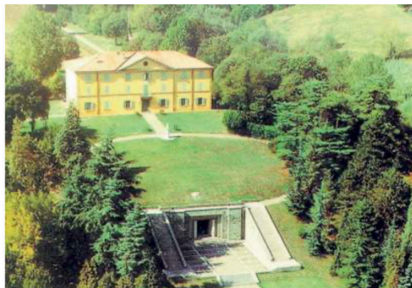
La villa di Marconi inserita nelle 8 tappe di "Ama Bologna"

Marzabotto fino a Castel di Casio. Baby Tasso e Nonno Tasso propongono giochi e domande sulle attività che da anni lavorano in Appennino: negozi di alimentari e botteghe artigianali. Chi risponde in modo corretto colleziona timbri coi quali si potrà vincere un premio da ritirare a ExtraBo, in piazza del Nettuno: i primi 50 che completeranno il Passaporto delle botteghe avranno anche una cesta da picnic con prodotti tipici dell'Appennino (in palio anche le borracce Hera che è sponsor). L'app, legata a Google Maps, si attiva solo quando le persone sono davanti alle botteghe storiche in mappa. Organizzata dall'Unione dei Comuni dell'Appennino Bolognese e dall'Unione Savena-Idice, «Tesori tra i monti» è arricchita an-