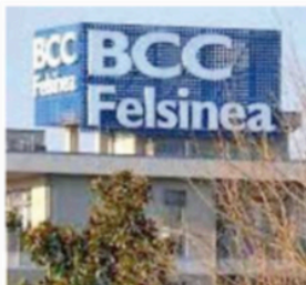
Un'ottima annata Per la BCC Felsinea il 2023 ha portato un utile di 12 milioni

«La soddisfazione per i risultati è ancora più grande se