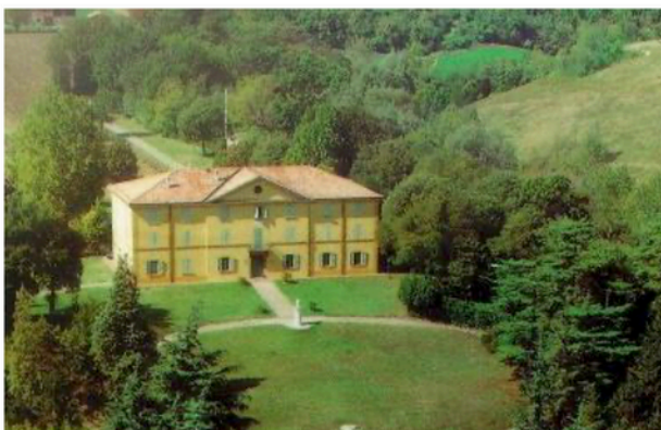
Villa Griffone, dove Marconi visse, lavorò e cambiò il mondo con le sue scoperte