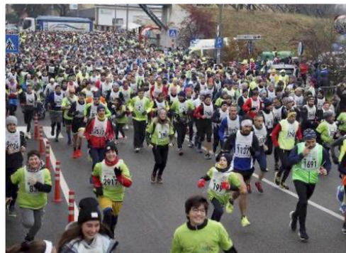
Gli atleti che hanno partecipato alla scorsa edizione della Galaverna di Pianoro