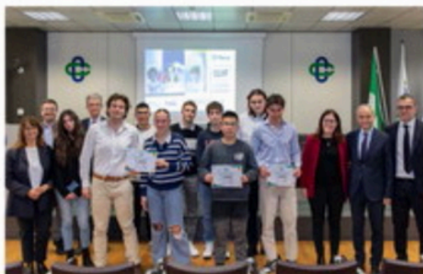
L'incontro di riconoscimento svoltosi a Bologna

Hanno accolto l'invito di RomagnaBanca, RivieraBanca e Bcc Sarsina a partecipare a questa edizione e vari istituti nel territorio: Valturio di Rimini, I.S.S. Marie Curie di Savignano sul Rubicone, I.S. Pascal Comandini di Cesena, I.S.I.S. Leonardo da Vinci di Cesenatico, Karis Foundation di Rimini, I.T.T.S. G. Marconi di