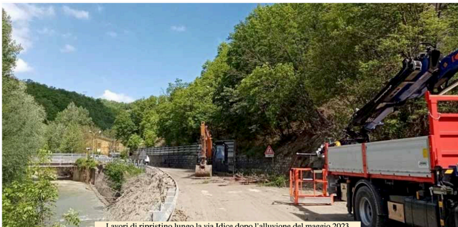
Lavori di ripristino lungo la via Idice dopo l'alluvione del maggio 2023